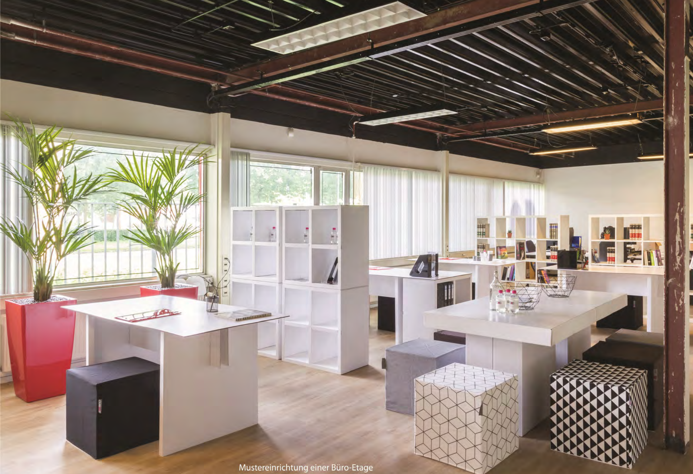
Mustereinrichtung einer Büro-Etage

Machen Sie es richtig! Verschenken Sie kein Geld!